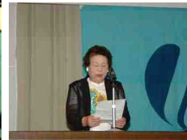
大会宣言を読む職建・保護司会々長