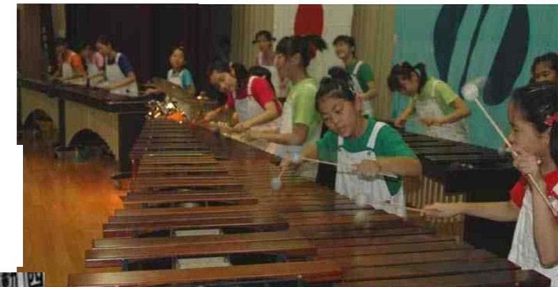
素晴らしい演技や演奏、合唱に拍手！拍手！