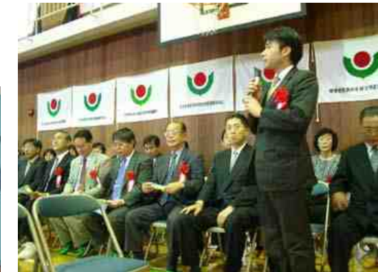
自己紹介をされる来賓の方々 殆どは区内の小・中学校の校長先生方です