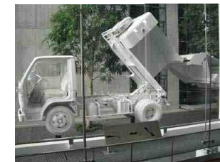
実際に使用された バッカー車をカットし、 展示してあります

ゴミを処理するのにものすごくお金が かかるというのが判った見学会でした。 なんでもすぐ捨てないで、 ゴミを減らし、リサイクルしなければ！ と思いました。