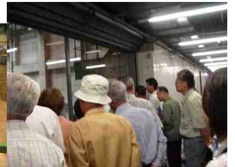
熱心に見学する参加者