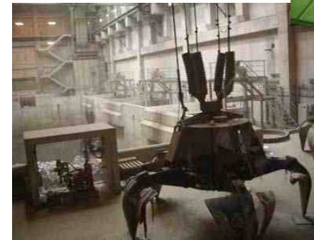
9トンのゴミをつかむ ゴミクレーン