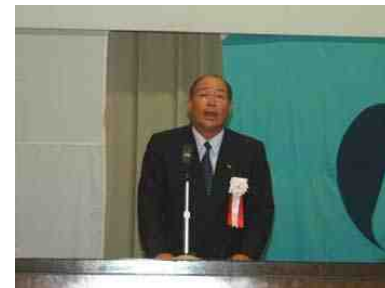
青少協・打越会長 挨拶