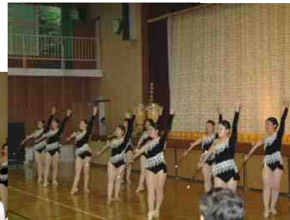
見事な幾田バトンスタジオさんの バトンの演技にウツリ