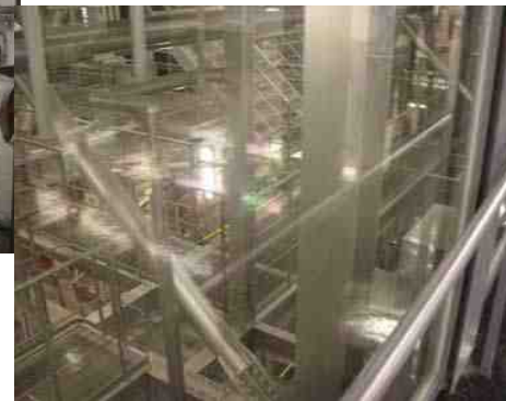
1基で200トンのゴミを焼却する 焼却ボイラー 焼却時にでる排ガスの有害物質を 取り除く設備