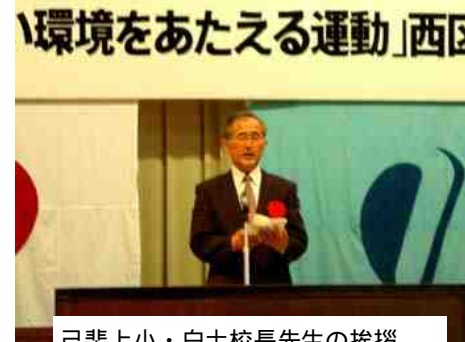
己斐上小・白土校長先生の挨拶